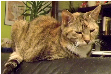
... und ihre Schwester Missi.

Hakuna und Matata haben würdige Nachfolgerinnen gefunden: An einem verregneten Freitagnachmittag Mitte Januar zogen die beiden knapp 17 Jahre alten Katzendamen auf dem Carlshof ein. Und auch sie widersprechen dem alten Sprichwort, dass man „einen alten Baum nicht verpflanzen“ dürfe.